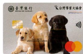
▲一卡通導盲犬認同卡