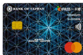
▲一卡通鈦金商旅卡